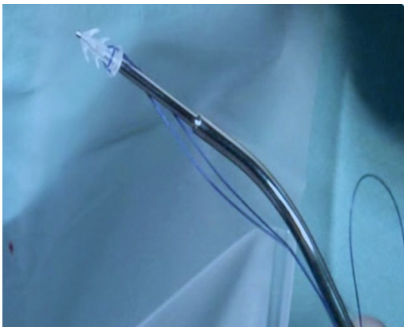
Obrázek stehu s fixační kotvou před jeho založením.

Prohlašuji, že jsem byla lékařem úplně a srozumitelně poučena o povaze svého onemocnění a plánovaném výkonu. Byla jsem poučena i o alternativách léčby a možných důsledcích v případě neprovedení tohoto výkonu. Během poučení jsem měla možnost klást lékaři doplňující otázky, a pokud tomu tak bylo, byly mi úplně a srozumitelně zodpovězeny. Jsem si vědoma všech rizik i komplikací spojených s tímto výkonem. Byla jsem poučena o tom, že mohu svůj souhlas s výkonem odvolat a také o tom, že odvolání souhlasu není účinné, pokud již bylo započato provádění zdravotního výkonu, jehož přerušování může způsobit vážné ohrožení zdraví nebo ohrožení života. Byla jsem informována a vzala jsem na vědomí, že předpokládaného výsledku uvedeného zdravotního výkonu nemusí být dosaženo. Poučení jsem rozuměla a s výkonem souhlasím.